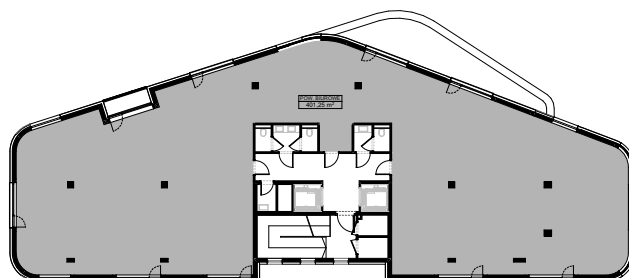
Wariant open space