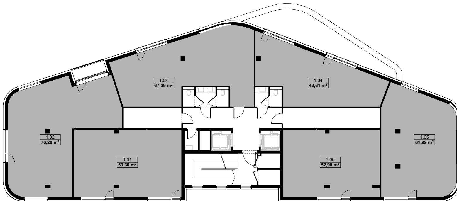
Wariant z podziałem kondygnacji